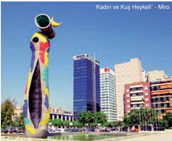
Kadın ve Kuş Heykeli - Miro