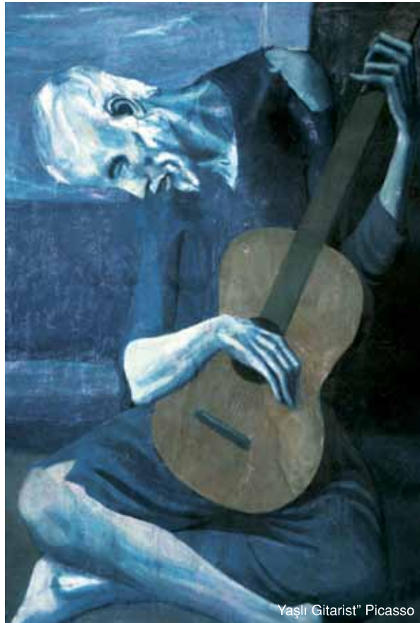
Yaşlı Gitarist" Picasso

Gezilerde günlerimiz hep koşma koşturmacayla geçiyor. Keşke gittiğimiz yerlerde bin bir telaşla iki ayağımızı bir pabuca sokmasak, alışveriş merkezlerinde doyumsuzca oradan oraya mekik dokumasak; parkların serinliğinde kösedeki banklardan birine oturup aklımızdan gittiğimiz yerin şairlerine ait birkaç dize geçirecek, müzisyenlerinden birinin bestesini mırıldansak, bir öyküyü, romanı, tiyatro oyununu anımsasak... ■