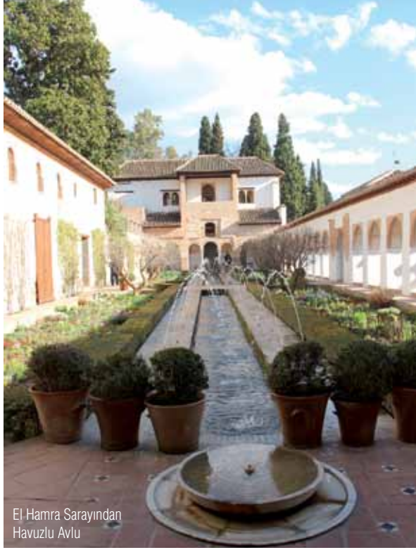
El Hamra Sarayı'ndan Havuzlu Avlu

Elhamra Sarayı da bir kısmı 1821'deki depremle yıkılmış olmakla birlikte, Endülüs Emevi Devleti'nden günümüze kalmış miraslardandır. I. Muhammed Dönemi'nde eski kalenin olduğu yere yapılmıştır. Gırnata'da, Sabika Tepesi'nde, kaya üzerinde yer alan bu sarayın adı Arapça kırmızı anlamına gelen el-Hamra'dan gelmektedir. Yapımında tapya denilen kerpeç, çakıllı kum ve balçıktan oluşan sert bir kerpeç kullanılmıştır. İçindeki kırmızı kil toprak ve gün batımında duvarlarından yansıyan kızılımsı güneş ışınları sarayın bu adla anılmasının sebebidir. Daha sonraları iki Nasrî sultanınca yeni yapılarla genişletilmiştir. Şarlken (V. Karl – Carlos) İspanya'ya verasetle hâkim olunca, 1527'de sarayın bazı bölümlerini yıktırılmıştır. İtalyan üslubunda iki kat sütunlu ve yuvarlak avlulu yaptırdığı ancak tamamı bitirilemeyen sarayı günümüzde Nasrî Sarayı ve Generalife Bahçesi ile birlikte gezilebilir durumdadır. Ormanlık alanı, çiçek bahçeleri, sebze dikili alanlar, binalar ve su kanallarıyla 3.455.000 metrekarelik bir alana yayılmış olan sarayın 655.000 metrekaresi ziyarete açıktır.