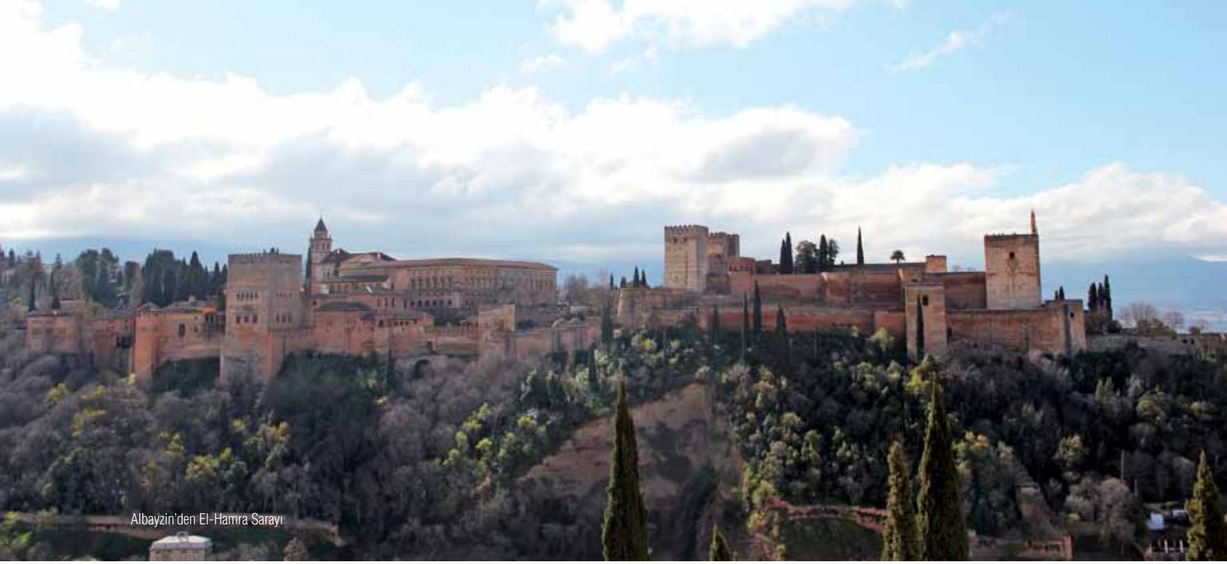
Albayzin'den El-Hamra Sarayı